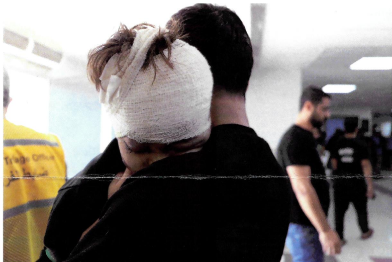
Un bambino ferito in un attacco aereo abbraccia suo padre dopo aver ricevuto cure all'ospedale Al Shifa.

Queste sono immagini dei nostri team che ho ricevuto e ho piacere di condividere con voi. Grazie.